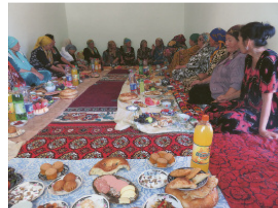
Frauen an einem gedeckten Tisch in Usbekistan, 2018