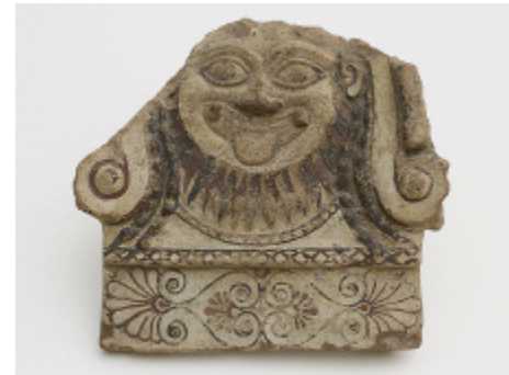
Antefix mit Gorgo, Capua, Ende 6. Jahrhundert v. Chr. Bemalter Ton Archäologisches Museum Frankfurt