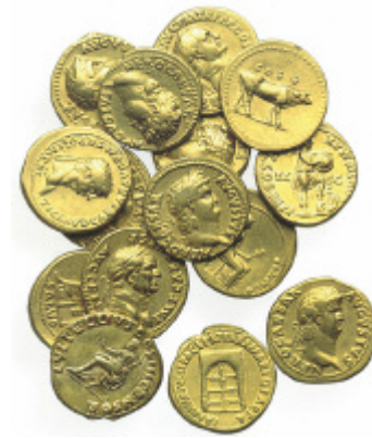
Goldschatz aus dem kleinen Haus am Hafentor, Xanten, Aurei, 2.–3. Jahrhundert n. Chr. LVR-Archäologischer Park Xanten

Ein Fotokunstprojekt von Studierenden der Hochschule RheinMain in Wiesbaden gibt den Forschenden des Graduiertenkollegs ein Gesicht. Die atmosphärisch schönen und humorvollen Schwarz-Weiß-Bilder porträtieren die Personen hinter der Wissenschaft und zeigen, dass diese durchaus ihre spielerischen Seiten haben kann.