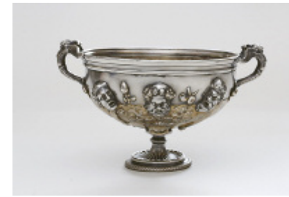
Sechsmaskenbecher aus dem Silberfund von Hildesheim, 1. Jahrhundert n. Chr. Galvanoplastische Nachbildung Privatbesitz